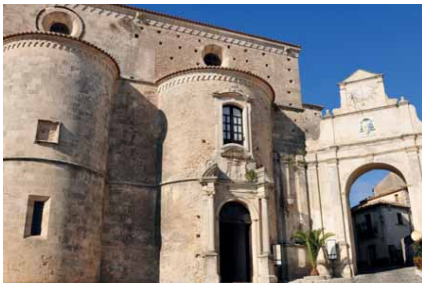
Ingresso della cripta della Cattedrale di Gerace. Sotto: particolare dell'interno della Cattolica di Stilo.