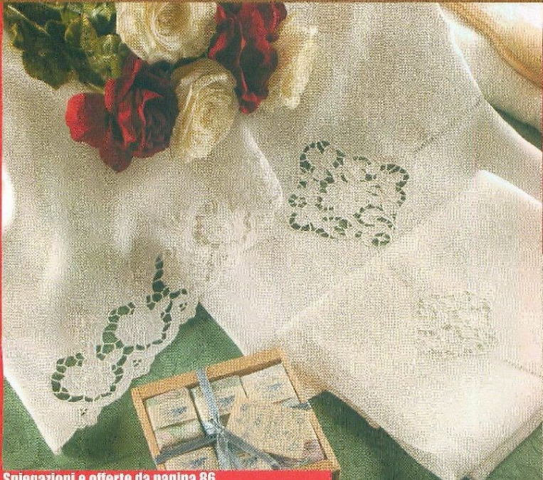
Spiegazioni e offerte da pagina 86